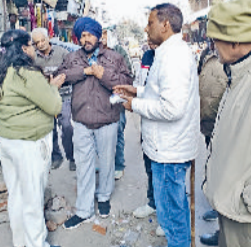
रोहतक। दुकानदारों को चालान काटते नगर निगम की एम्फोसमेंट टीम।