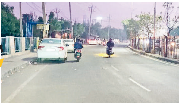
सेक्टर एक के पास यहां पर बनना था ओवर ब्रिज।

आईसी कॉलेज, जाट कॉलेज, सेक्टर 1 और सेक्टर 14 के बीच बनने थे ब्रिज। इससे हजारों लोगों को मिलना था फायदा