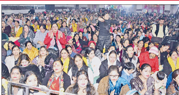
रोहतक। गोकर्ण डेरा पर आयोजित भजन संध्या में भजन सुनते भक्तजन

धूम मचा दी। इससे पूर्व गोकर्ण धाम के पीठाधीश्वर व उपाचार्य महाराज ने पुण्यतिथि की पूर्व संध्या पर उनकी प्रतिमा के सामने दीप जलाकर कार्यक्रम का शुभारंभ